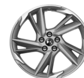
19" Leichtmetallfelge ROM