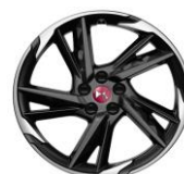
19" Leichtmetallfelge PEKING