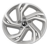
17" Leichtmetallfelge BERLIN

● : Serienmässig ○ : Option - : Nicht erhältlich