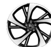
20" Leichtmetallfelge TOKYO