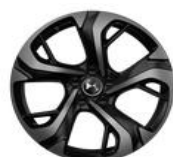
18" Leichtmetallfelge GENF