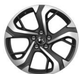
18" Leichtmetallfelge BUENOS AIRES